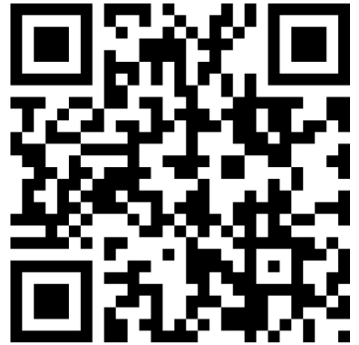
Digitaler Antrag auf Streikunterstützung

Die Streikerfassung erfolgt dann am Streiktag durch Abscannen, des individuellen QR-Codes, den du erhältst.